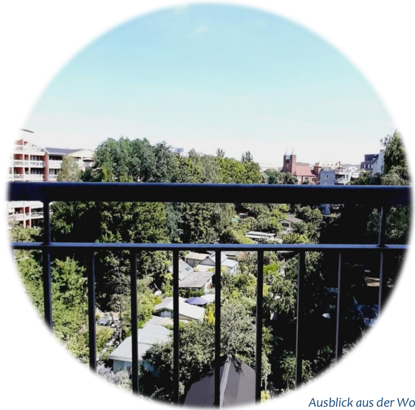
Ausblick aus der Wohnung