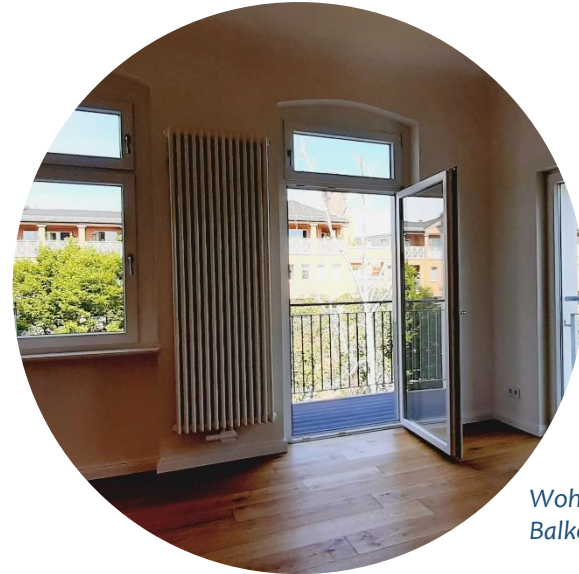
Wohnzimmer / Balkon

Die Wohnbereiche sind mit Vollholz-Eichenparkett ausgestattet.