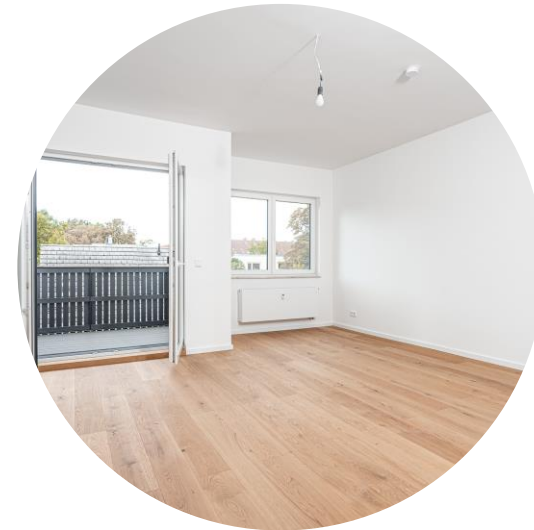
Wohnzimmer mit Balkon

Die gesamte Wohnung ist mit einer modernen, zentralen Klimaanlage ausgestattet, die an warmen Tagen für eine angenehme und gleichmäßige