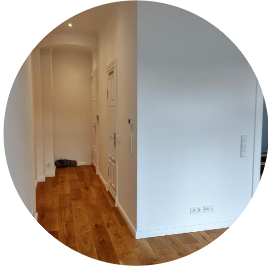
Eingang / Flur