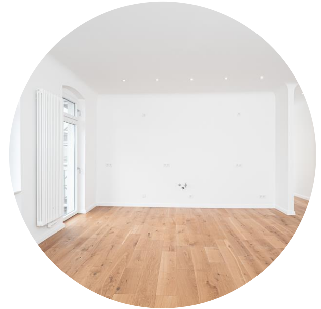
Wohnbereich mit Balkon und Küchenbereich