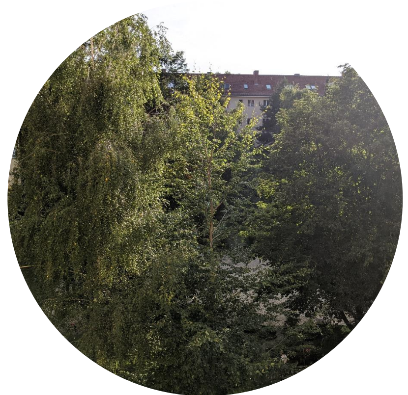
Ausblick aus der Wohnung

Herrn Eldar Shevach Tel: +49(0) 160 93 16 80 82 Email: info@preismeyer.com