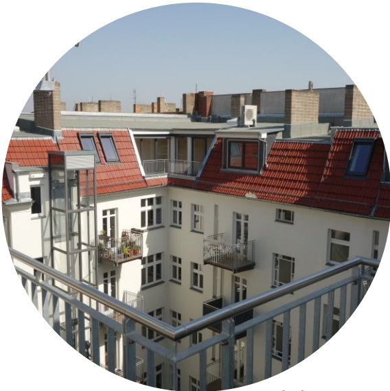
Blick vom Dach