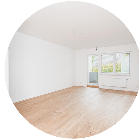
Wohnzimmer mit Balkon

Beheizt wird die Wohnung über eine moderne, neu installierte Pelletheizung, die sowohl effizient als auch umweltfreundlich arbeitet.